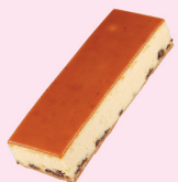
乳酪蛋糕 $ 350