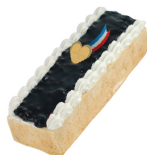
法國藍莓蛋糕 $ 320