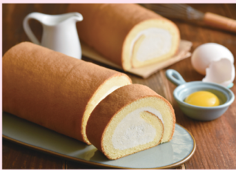
北海道生乳捲 單條 $280 (原味 / 香芋)