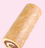
巧克力蛋糕捲 $ 300