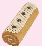
咖啡奶油捲 $ 300