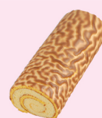
虎皮蛋糕 $ 300