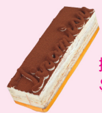
提拉米蘇 $ 320