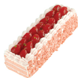
草莓蛋糕 $ 380