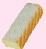
鳳梨秀口蘭 $ 320