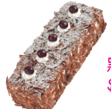
黑森林蛋糕 $ 320