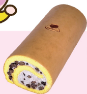
黃金芋泥捲 $ 350