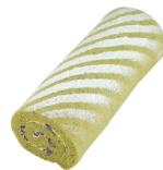
抹茶紅豆捲 $ 300