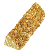
咖啡核桃 $ 320