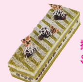
抹茶蛋糕 $ 320