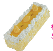
檸檬蛋糕 $ 320