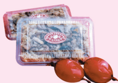
油飯、紅蛋 -半斤裝- $ 60/盒 口味 一般/素食 紅蛋 $15/粒