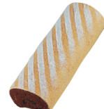
巧克力藍莓捲 $ 300