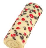
瑞士捲 $ 300