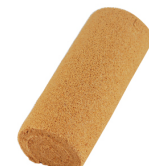
咖啡捲 $ 300