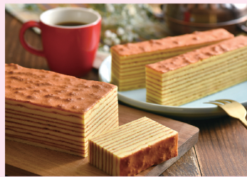
荷蘭千層蛋糕 單條 $ 300