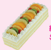
綜合水果蛋糕 $ 320