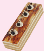
摩卡須尼丁 $ 320